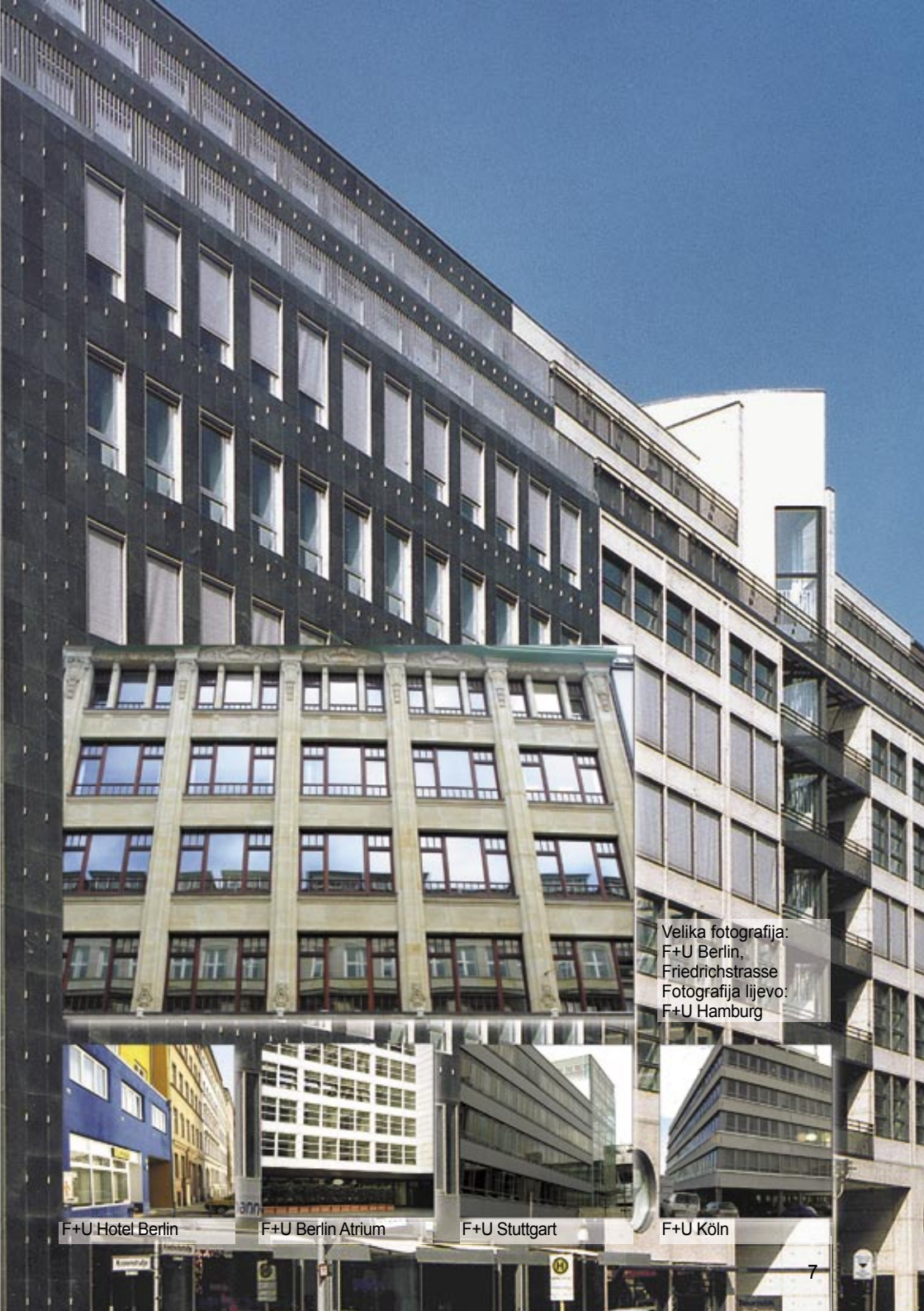
Velika fotografija: F+U Berlin, Friedrichstrasse Fotografija lijevo: F+U Hamburg