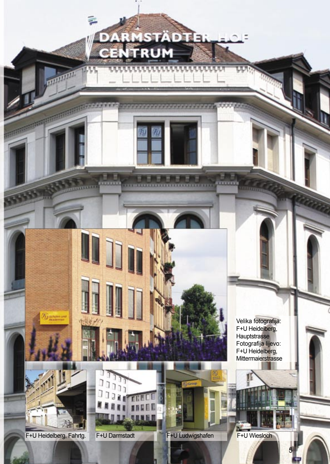
Velika fotografija: F+U Heidelberg, Hauptstrasse Fotografija lijevo: F+U Heidelberg, Mittermaierstrasse

Preuzimanje "Benedict-School" u Zwickau.