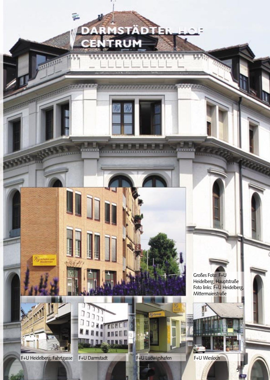
Großes Foto: F+U Heidelberg, Hauptstraße Foto links: F+U Heidelberg, Mittermaierstraße

Eröffnung der Internationalen Berufsakademie Südhessen, der neuen Standorte in Hamburg und Köln und Betriebsaufnahme der Internationalen Fernfachhochschule in Chemnitz. Gründung der F+U Litauen in Vilnius und der F+U Kroatien in Zagreb. Übernahme der Benedict-School in Zwickau.