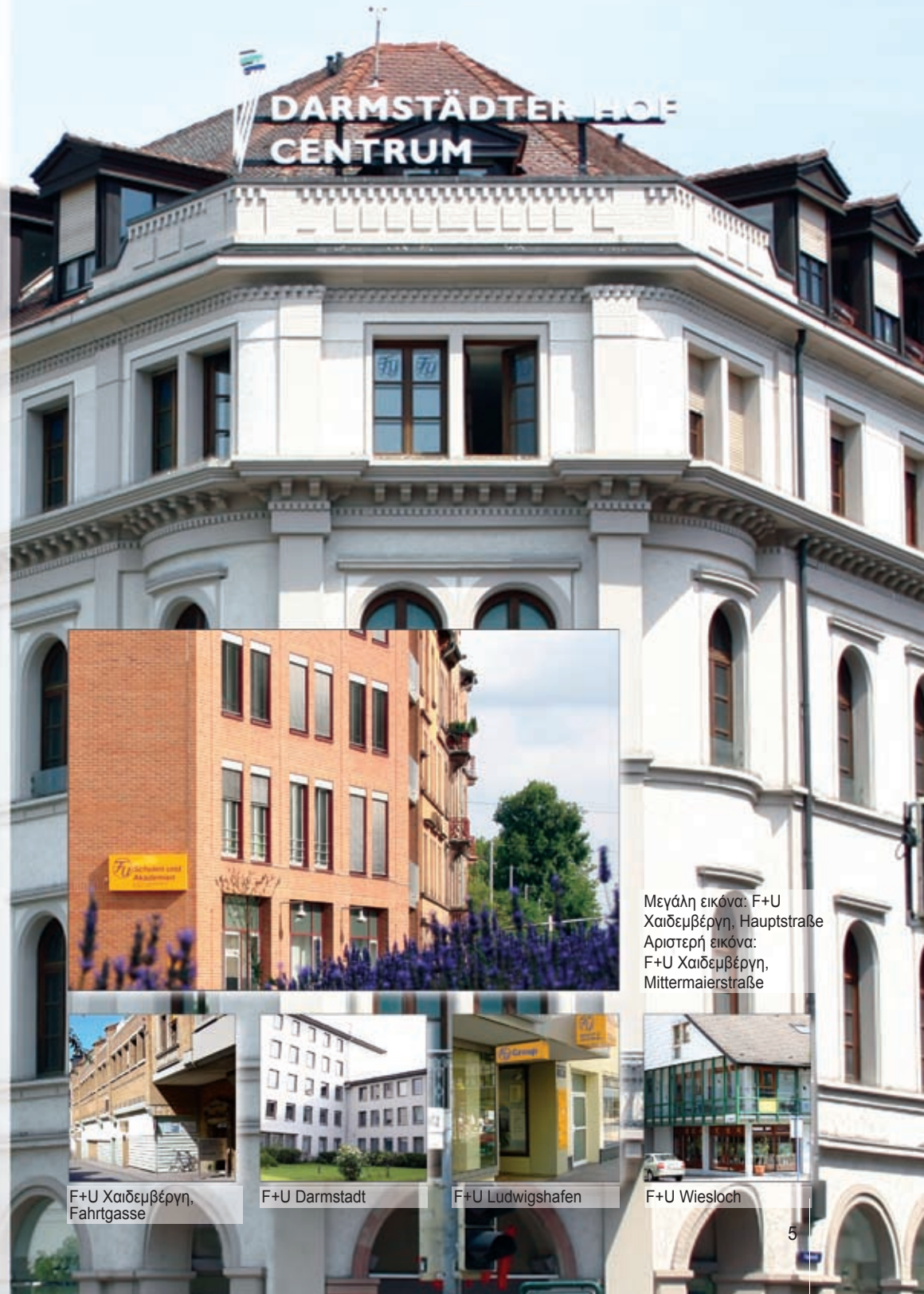
Μεγάλη εικόνα: F+U Χαιδεμβέργη, Hauptstraße Αριστερή εικόνα: F+U Χαιδεμβέργη, Mittermaierstraße

Εγκαίνια της διεθνούς επαγγελματικής ακαδημίας στο κρατίδιο της νοτίου Έσσης, των καινούργιων γραφείων μας στο Αμβούργο και στη Κολωνία. Έναρξη μαθημάτων της διεθνούς, ειδικής ανώτατης σχολής για σπουδές εξ' αποστάσεως στο Chemnitz. Ίδρυση της F+U στο Vilnius και της F+U στην Κροατία, στο Ζάγκρεβ. Ανάληψη του σχολείου του Βενέδικτου στο Zwickau.