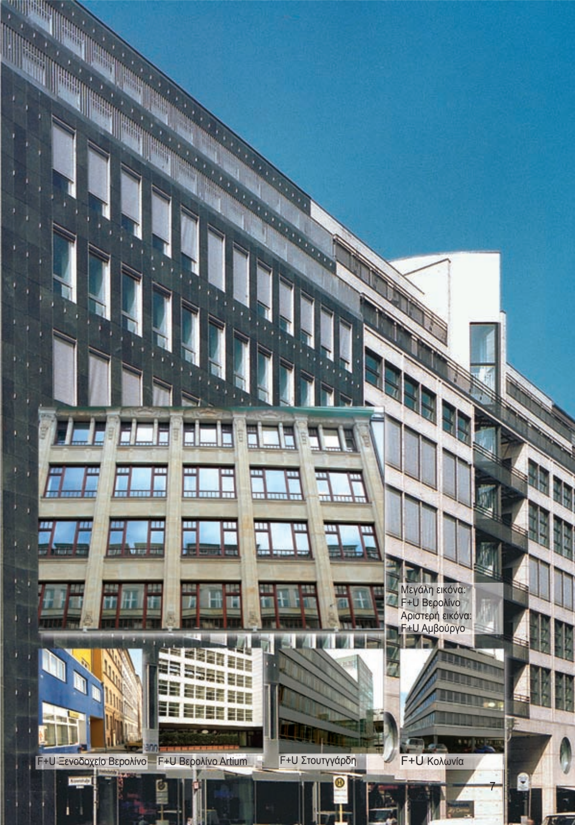
Μεγάλη εικόνα: F+U Βερολίνο Αριστερή εικόνα: F+U Αμβούργο