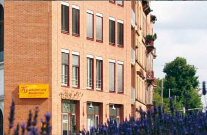
büyük fotoğraf: F+U Heidelberg, Hauptstr. soldaki fotoğraf: F+U Heidelberg, Mittelmeierstrasse