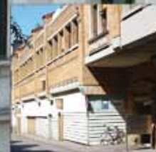
F+U Heidelberg, Fahrtg.