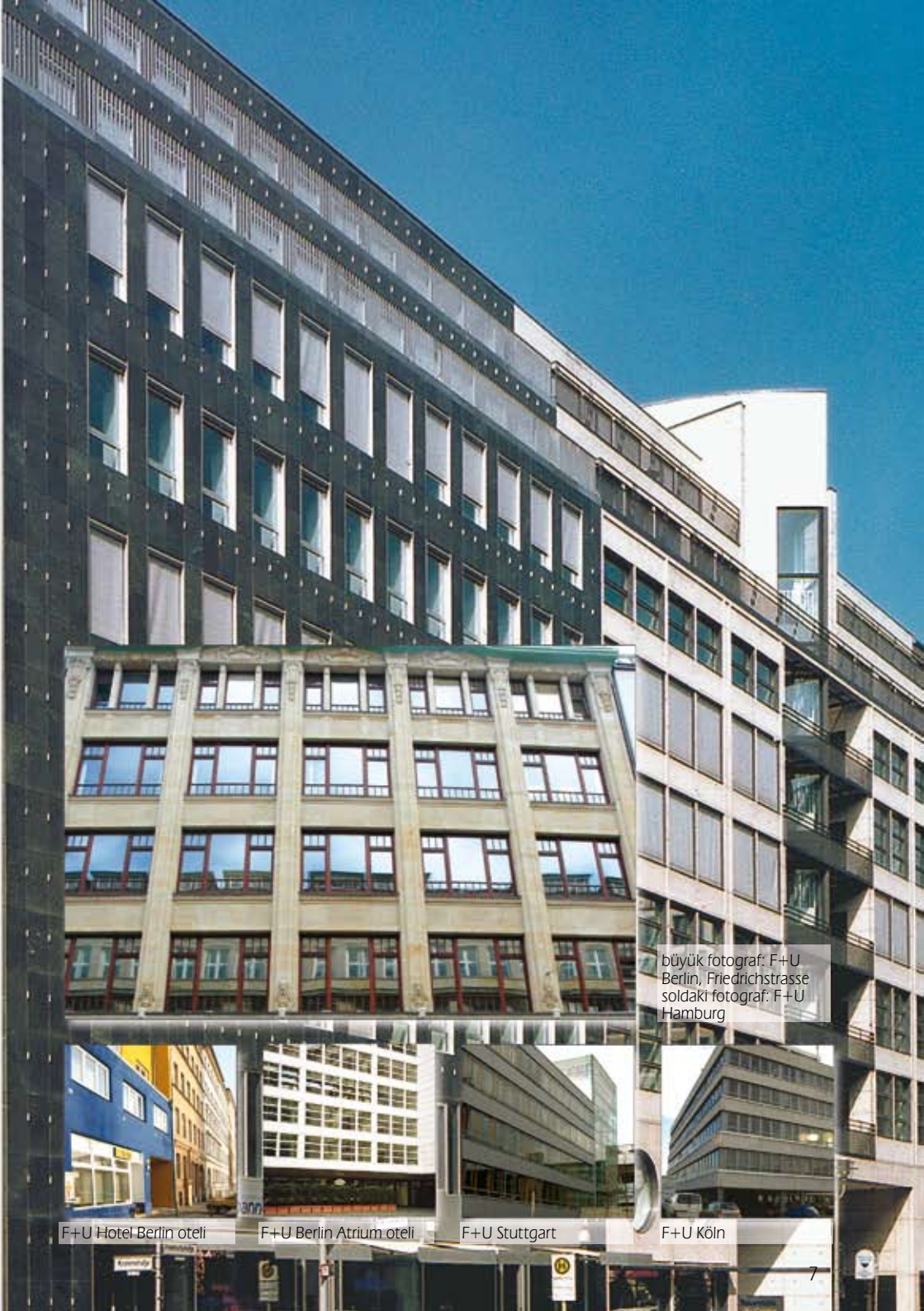
büyük fotoğraf: F+U Berlin, Friedrichstrasse soldaki fotoğraf: F+U Hamburg