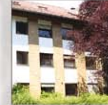
F+U Heidelberg, talebeler yurdu